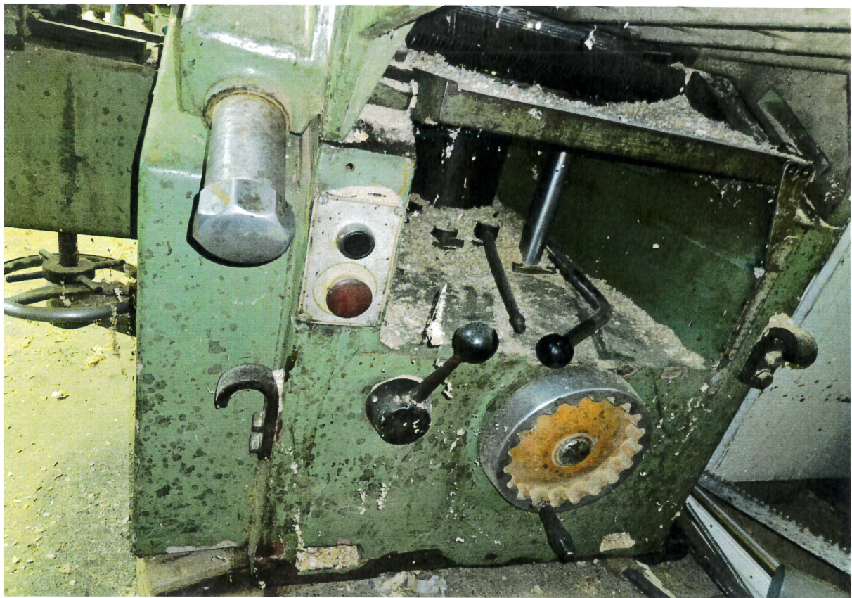
Fot. 3 System sterowania obrabiarką