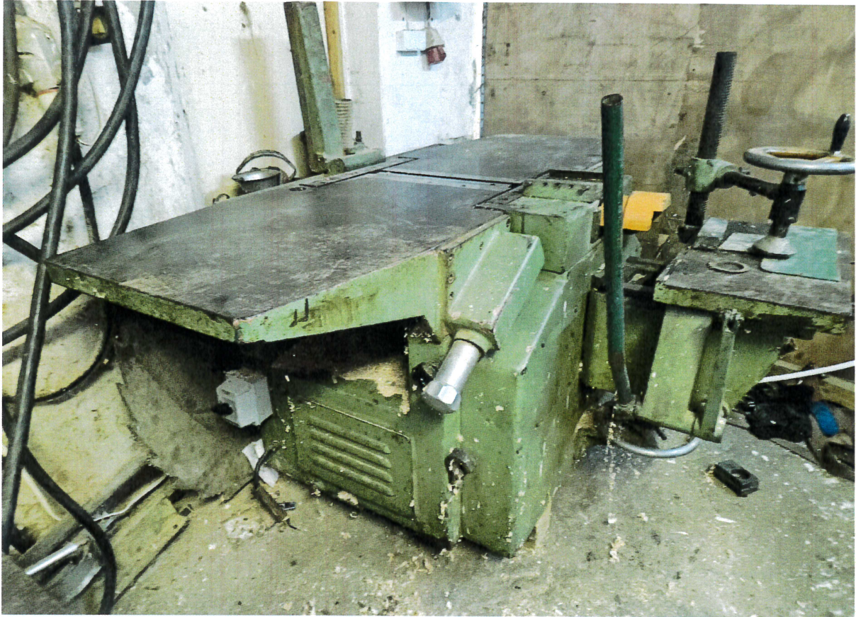
Fot.2 Widok obrabiarki z boku.