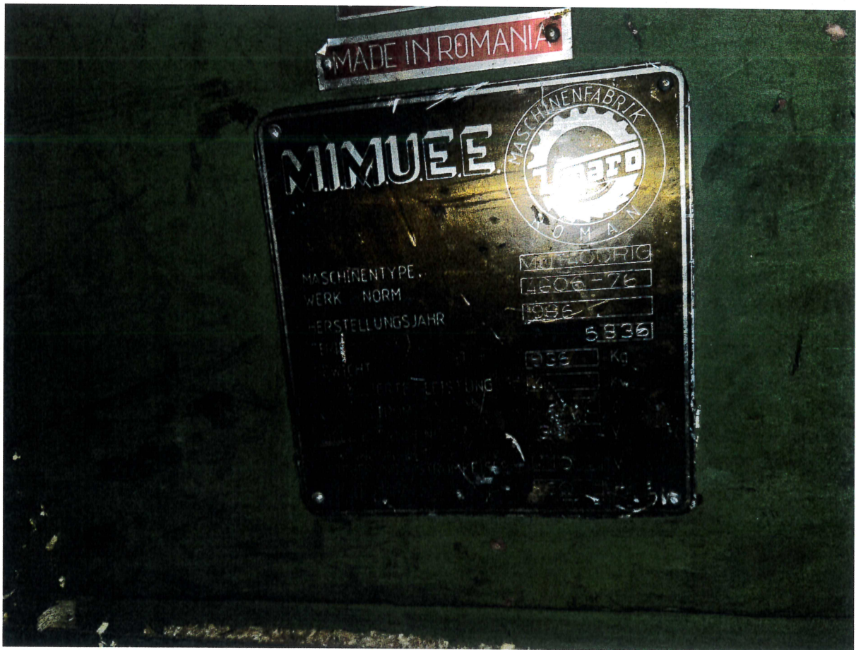
Fot. 3 Tabliczka fabryczna.