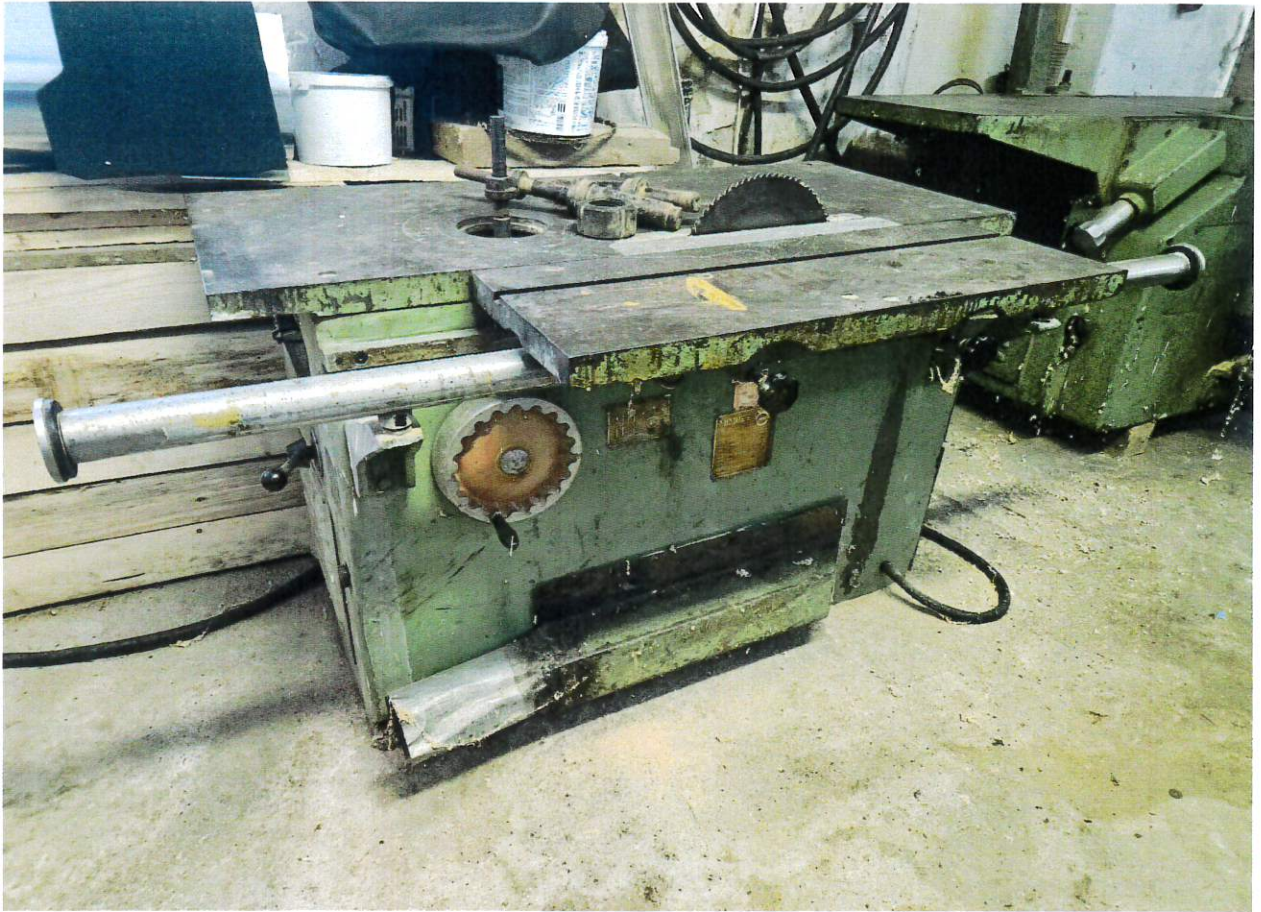
Fot. 1 Widok obrabiarki z przodu.